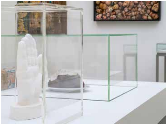
Daniil Shumikhins „The Hand“ und „Tamerlan's Memorial“ von Armand Pierre Fernandez im Kuratorinnen-Rundgang TRANSITION.