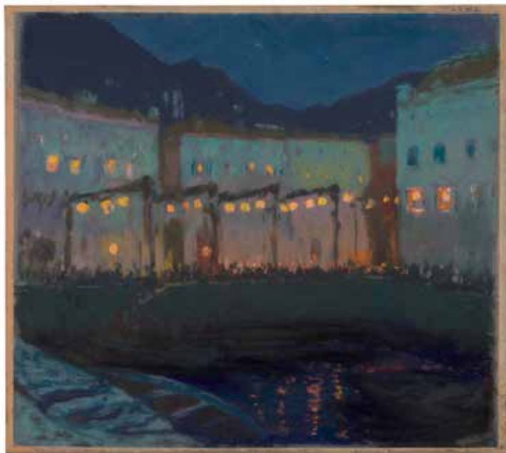
Melchior Lechter, Nächtliches Volksfest am Gardasee, 1910, LWL Museum für Kunst und Kultur.

Gefördert von: Kunststiftung NRW, Stiftung der Sparkasse Münsterland Ost